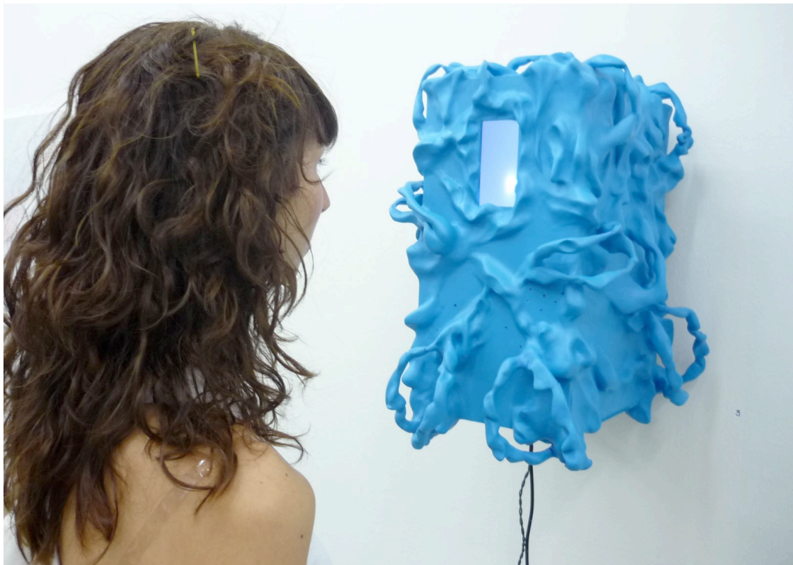
Fotografía 7. Una joven estudiante de obra observando la obra de Satomi Oonishi/ A young art history student gazing a Satomi Oonishi sculpture.