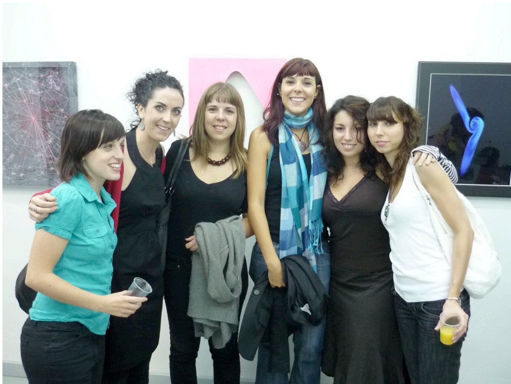
Fotografía 12. Fotografía de jóvenes promesas de la Historia del Arte, interesadas por las nuevas propuestas orientales/ Young Art Historicians keen on Japanese art.